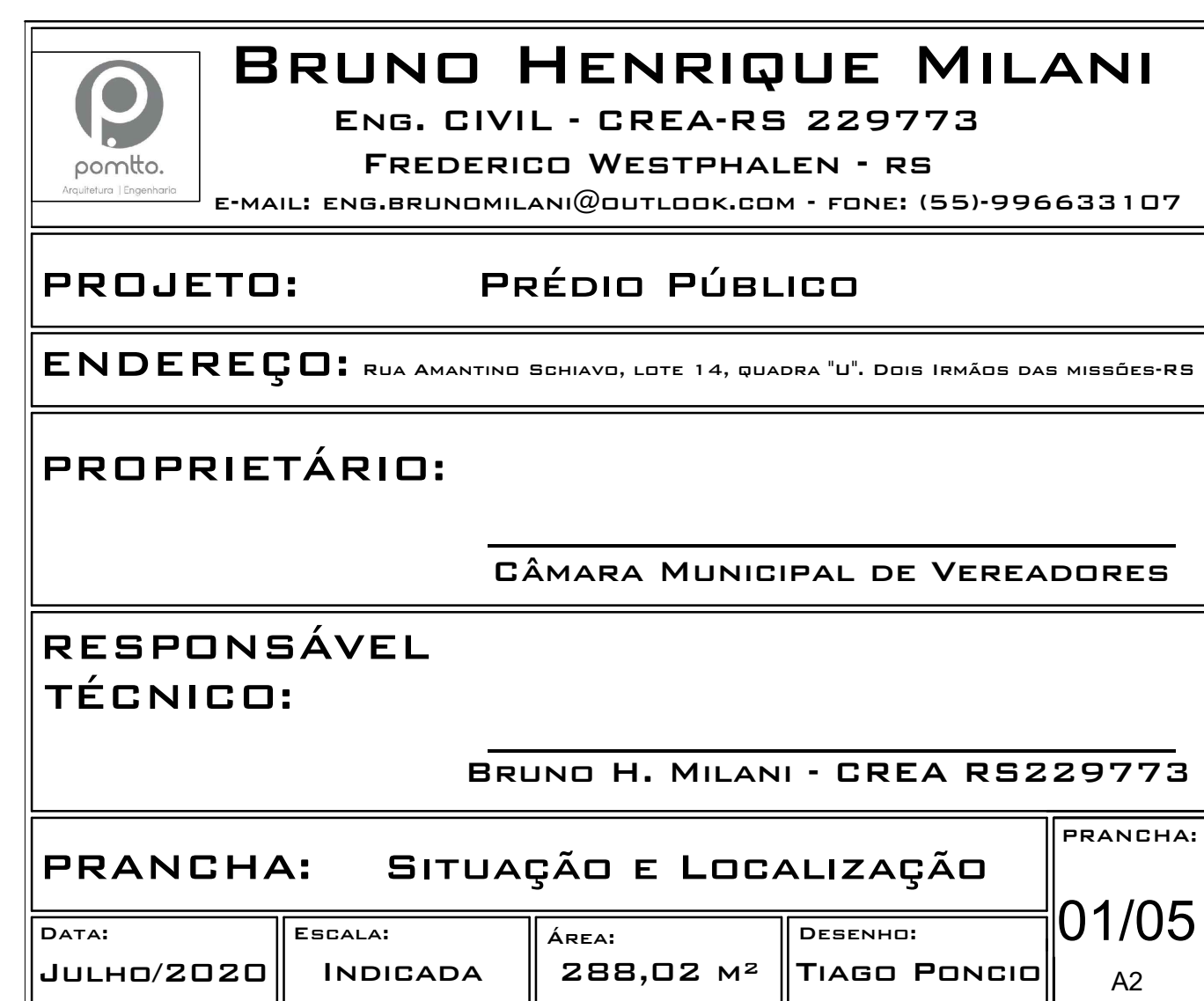
PLANTA DE LOCALIZAÇÃO ESCALA: 1/200