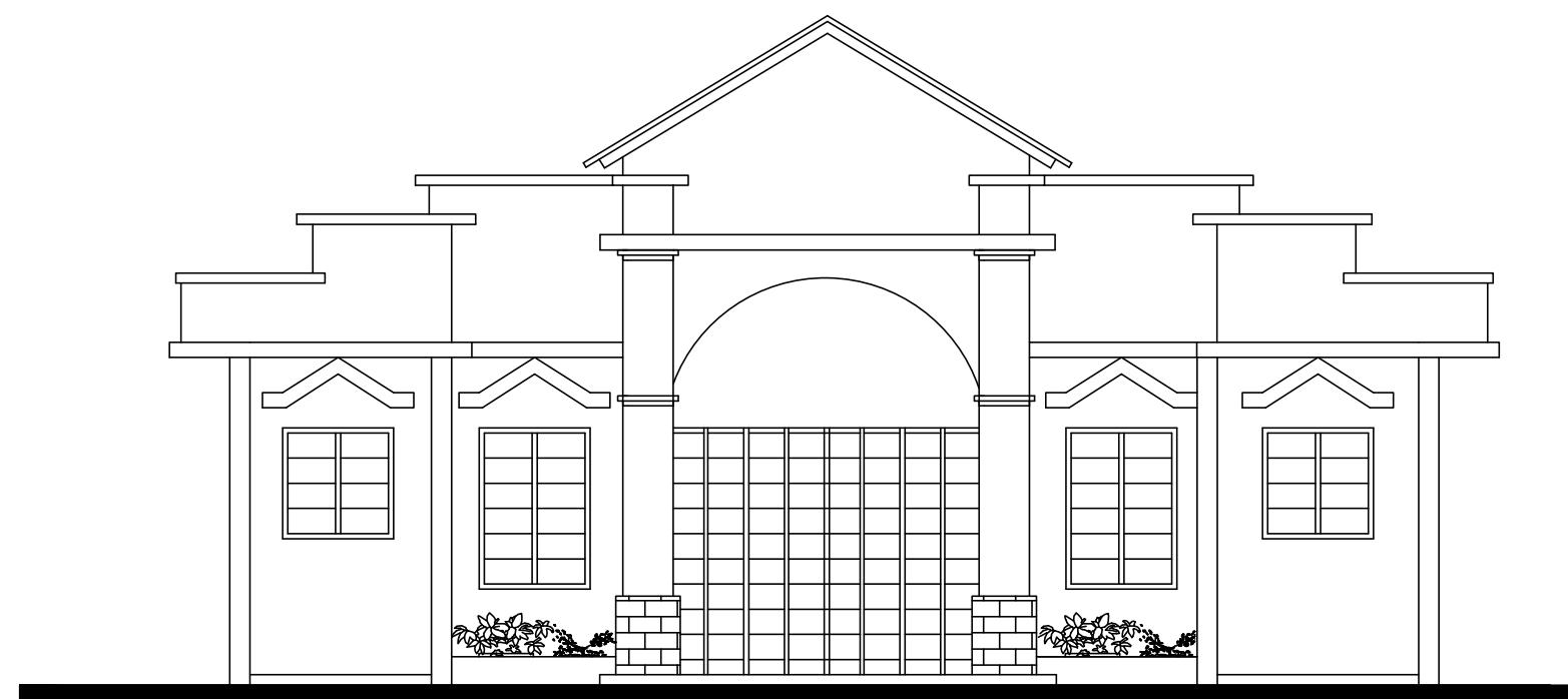
FACHADA: FRENTE ESCALA: 1/75